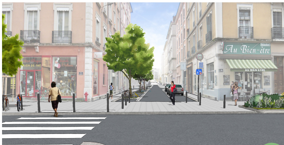
Entrée de la rue Lazare-Carnot depuis la rue Lesdiguières

Dans le même temps des travaux vont être réalisés rue Humbert-II : un chantier de rénovation des réseaux enterrés par les entreprises concessionnaires, suivis d'une réfection de la chaussée.