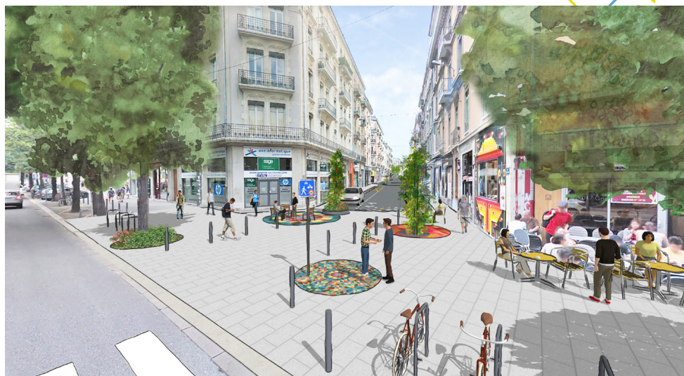
Entrée de la rue Lakanal depuis le boulevard Gambetta